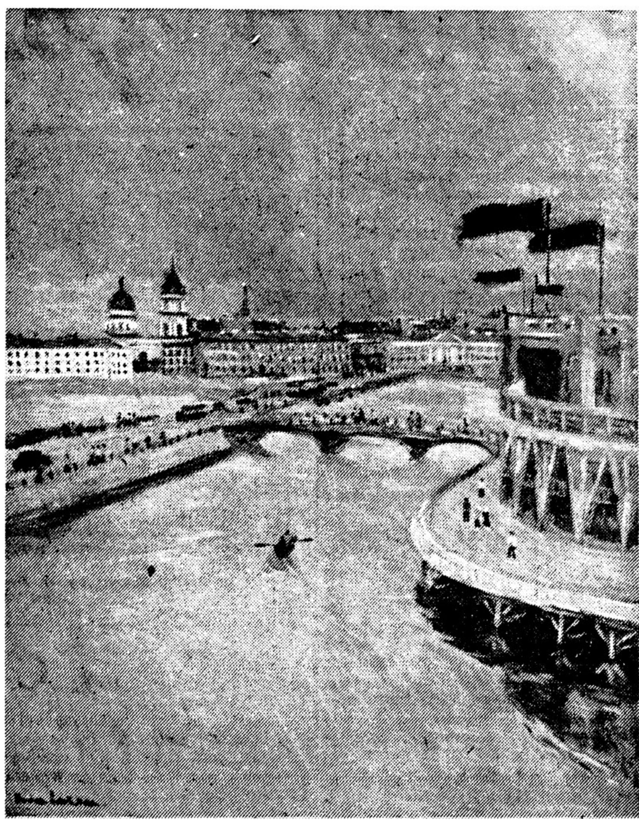
Из картин Натана Альтмана, выставленных в Московском клубе писателей.